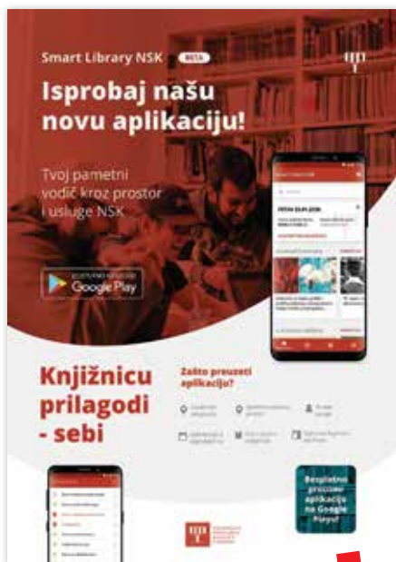
Smart Library NSK

Putem navedenih interdisciplinarnih usluga i programa Digitalnog laboratorija NSK knjižnica nastoji prilagoditi svoju organizacijsku kulturu kako bi brzo, učinkovito i uspješno odgovorila na sve izazove koje pred nju stavlja suvremeni korisnik te aktivno sudjelovala u stvaranju digitalnog društva. Rezultat tih nastojanja ogledat će se u osiguravanju inače nedostupne opreme, alata i softvera korisnicima i široj javnosti, edukacijama, radionicama i raznim događanjima s ciljem kreativnog korištenja novih tehnologija te realizaciji novih projekata utemeljenih na novim partnerstvima u javnom i privatnom sektoru, sve u svrhu proširivanja tradicionalne uloge Knjižnice za nove načine učenja, rada, igre i življenja. ■