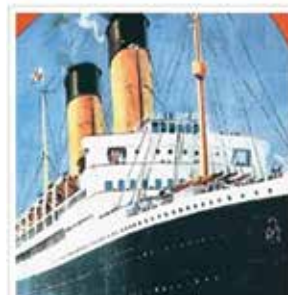
Digitalna zbirka inozemne Croatice