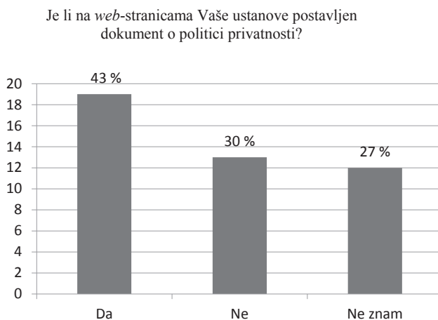
Slika 1. Objava dokumenta o politici privatnosti matične ustanove

Trećom vrstom pitanja ispituje se ispunjavanje načela transparentnosti i mogućnost korisnikova ostvarivanja prava poput onog na pristup osobnim podacima putem knjižničnoga programa i prava na ispravak. Tako se 43 % knjižnica izjasnilo da je na web -stranicama matične ustanove postavljen dokument o politici privatnosti (Slika 1.). Ostale su se knjižnice gotovo u jednakom broju izjasnile negativno (30 %) ili da im je ovo nepoznato (27 %).