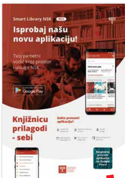
Smart Library NSK

Putem navedenih interdisciplinarnih usluga i programa Digitalnog laboratorija NSK knjižnica nastoji prilagoditi svoju organizacijsku kulturu kako bi brzo, učinkovito i uspješno odgovorila na sve izazove koje pred nju stavlja suvremeni korisnik te aktivno sudjelovala u stvaranju digitalnog društva. Rezultat tih nastojanja ogledat će se u osiguravanju inače nedostupne opreme, alata i softvera korisnicima i široj javnosti, edukacijama, radionicama i raznim događanjima s ciljem kreativnog korištenja novih tehnologija te realizaciji novih projekata utemeljenih na novim partnerstvima u javnom i privatnom sektoru, sve u svrhu proširivanja tradicionalne uloge Knjižnice za nove načine učenja, rada, igre i življenja. ■