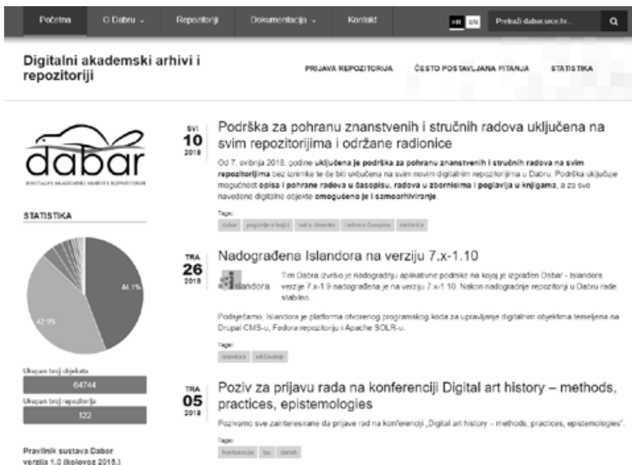
Slika 1. Naslovnica Dabra

tima pristupa i korištenja. Sustav je pušten u produkcijski rad u kolovozu 2015. godine, a do ožujka 2018. godine uspostavlja se 121 repozitorij (slika 1). 14