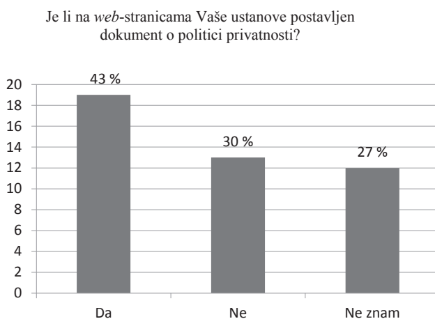
Slika 1. Objava dokumenta o politici privatnosti matične ustanove

Trećom vrstom pitanja ispituje se ispunjavanje načela transparentnosti i mogućnost korisnikova ostvarivanja prava poput onog na pristup osobnim podacima putem knjižničnoga programa i prava na ispravak. Tako se 43 % knjižnica izjasnilo da je na web -stranicama matične ustanove postavljen dokument o politici privatnosti (Slika 1.). Ostale su se knjižnice gotovo u jednakom broju izjasnile negativno (30 %) ili da im je ovo nepoznato (27 %).