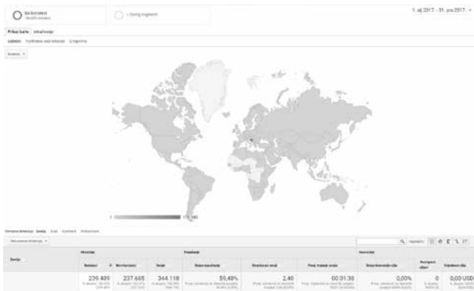
Slika 7. Podaci o posjećenosti ZIR-a u razdoblju od 1. 1. 2017. do 31. 12. 2017. prema Google Analyticsu

Nacionalni repozitoriji prate i posjećenost putem Google Analyticsa te je uočeno da se radovima pristupa sa svih kontinenata. Tako je primjerice na ZIR-u u 2017., što prikazuje i slika 7, broj online posjeta bio 344 118, s ukupno 827 153 pregledane stranice, a posjetitelji su se zadržavali 1:38 minuta. Podaci o posjećenosti za DR su manji: broj online posjeta bio je 10 746, pregleda stranica 46 017, a korisnici su se na portalu zadržavali 2:47 minuta. Razlog je tomu još uvijek mali broj repozitorija koji pohranjuju disertacije te se taj podatak neminovno odražava i na samu posjećenost.