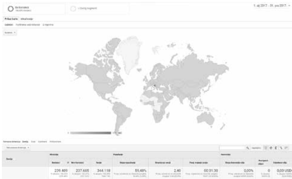
Slika 7. Podaci o posjećenosti ZIR-a u razdoblju od 1. 1. 2017. do 31. 12. 2017. prema Google Analyticsu

Nacionalni repozitoriji prate i posjećenost putem Google Analyticsa te je uočeno da se radovima pristupa sa svih kontinenata. Tako je primjerice na ZIR-u u 2017., što prikazuje i slika 7, broj online posjeta bio 344 118, s ukupno 827 153 pregledane stranice, a posjetitelji su se zadržavali 1:38 minuta. Podaci o posjećenosti za DR su manji: broj online posjeta bio je 10 746, pregleda stranica 46 017, a korisnici su se na portalu zadržavali 2:47 minuta. Razlog je tomu još uvijek mali broj repozitorija koji pohranjuju disertacije te se taj podatak neminovno odražava i na samu posjećenost.