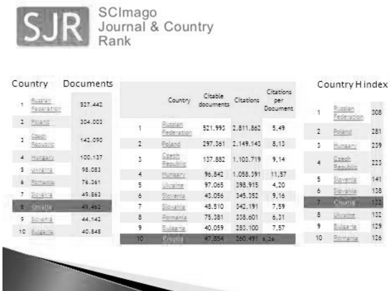
Slika 1. Položaj Hrvatske na portalu SJR 2011.

Po broju dokumenata na SJR portalu, Hrvatska se od 24 istočnoeuropske zemlje nalazi na 8. mjestu, po broju citata na 10. mjestu, a po h-indeksu na 7. mjestu (Slika 1).