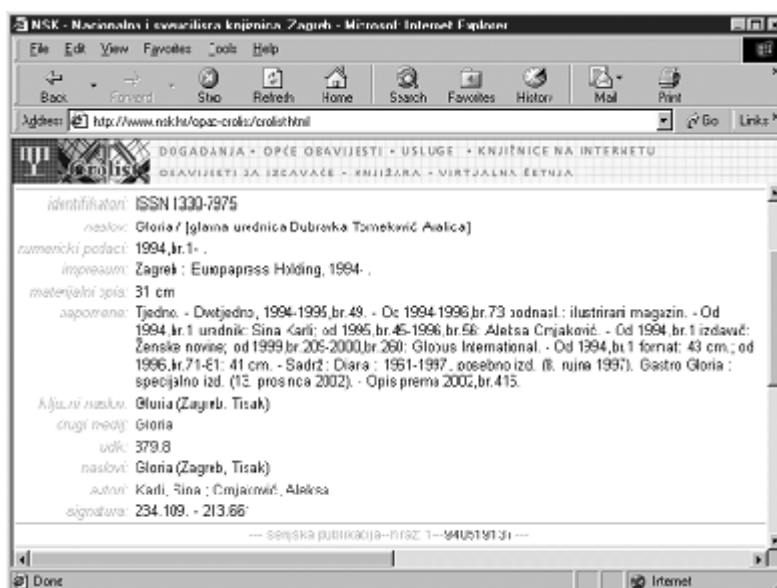
Primjer 2. Ključni naslovi s kvalifikacijama za mrežno i tiskano izdanje časopisa Gloria